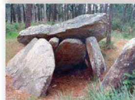
Dolmen de Pedra da Arca.