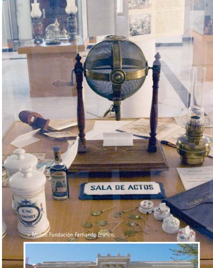
> Museo Fundación Fernando Blanco.