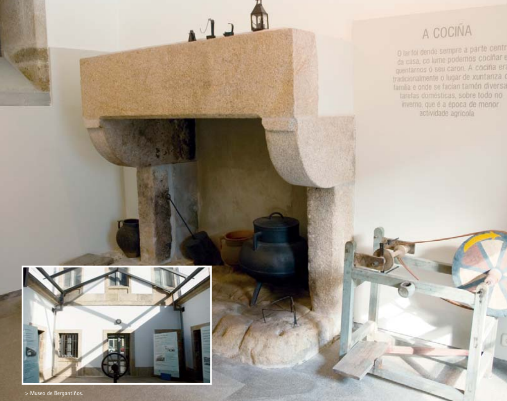
> Museo de Bergantiños.