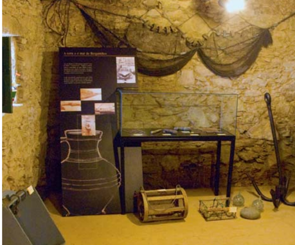
> Ecomuseo do Forno do Toxo.