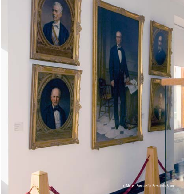
> Museo Fundación Fernando Blanco.