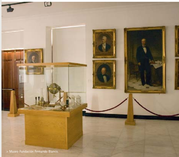
> Museo Fundación Fernando Blanco.