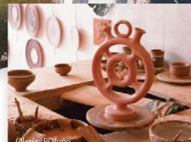
Olería de Buño.