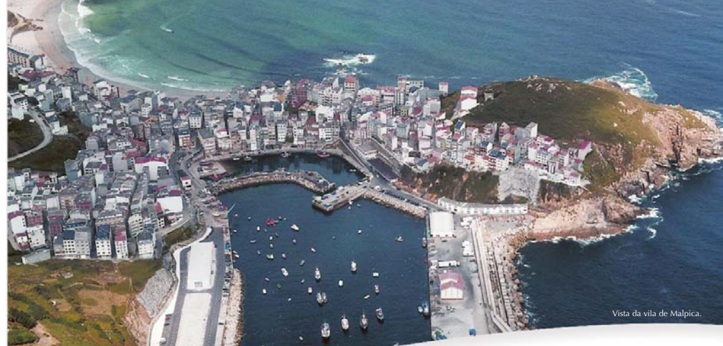
Vista da vila de Malpica.