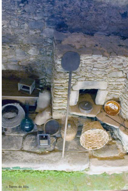
> Torres do Allo.