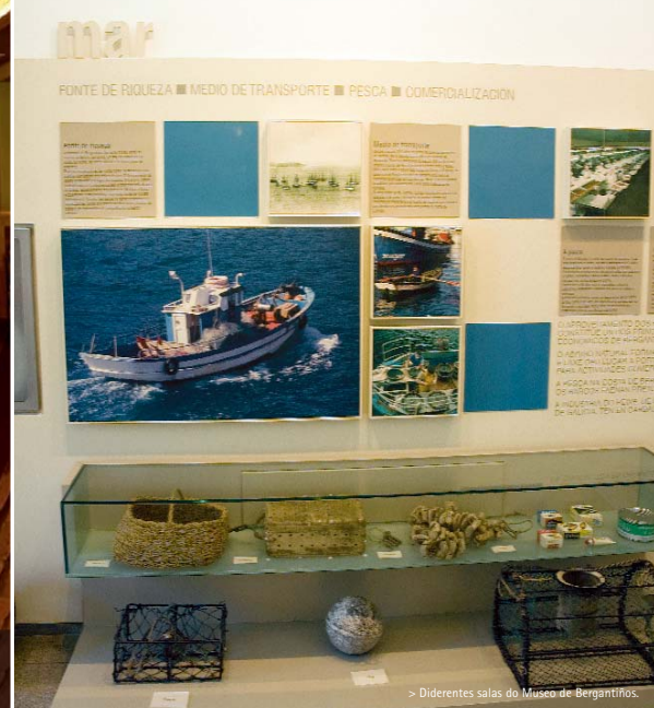
> Diferentes salas do Museo de Bergantiños.

Calle Eduardo Pondal, 14 Ponteceso Tel. 981 71 45 72