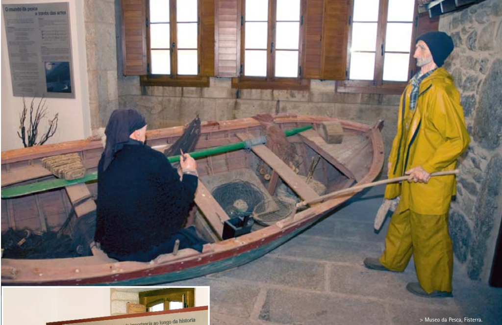
> Museo da Pesca, Fisterra.