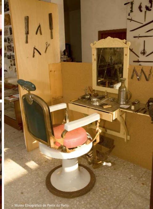
> Museo Etnográfico de Ponte do Porto.