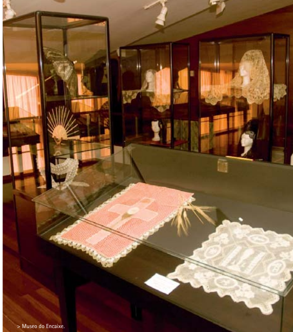
> Museo do Encaixe.