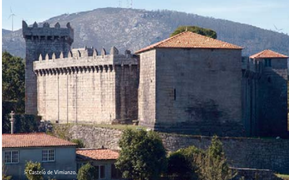
> Castelo de Vimianzo.