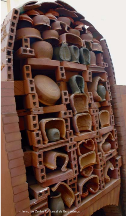
> Forno no Centro Comarcal de Bergantiños.

hábitat do arao, ave en perigo de extinción; e catro paneis explicativos.