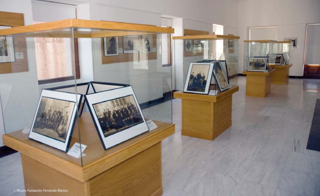
> Museo Fundación Fernando Blanco.