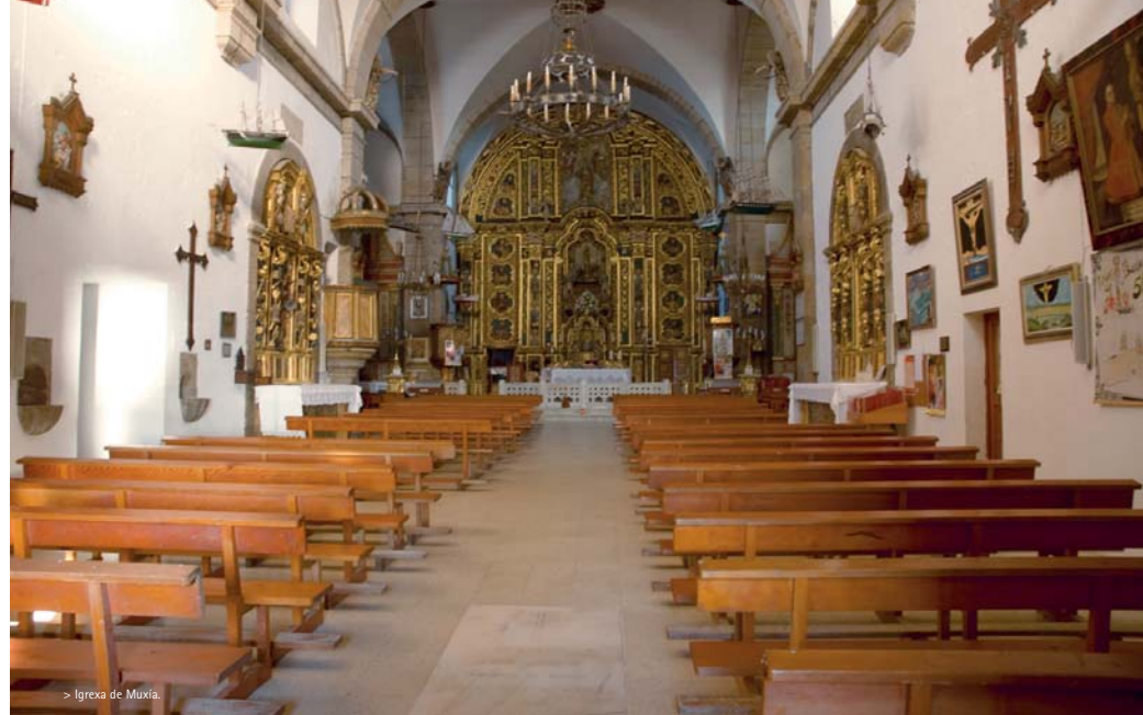
> Igrexa de Muxía.