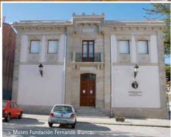
> Museo Fundación Fernando Blanco.