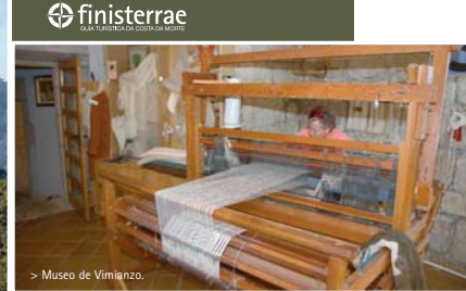
> Museo de Vimianzo.