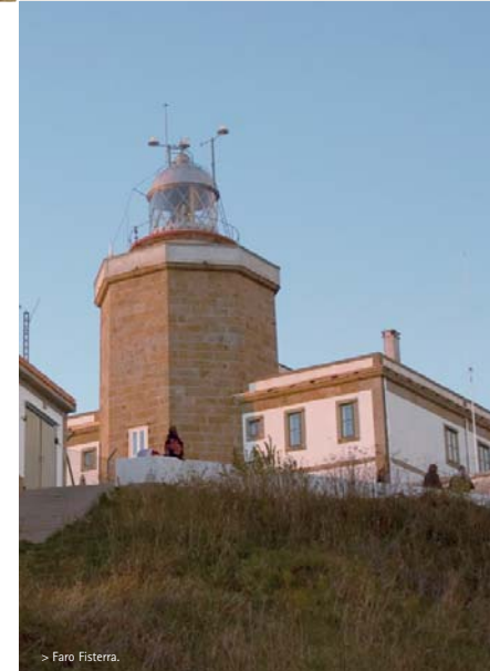
> Faro Fisterra.

mole pétrea do monte Pindo e a costa de Carnota, e aos pés o novo cimiterio do municipio deseñado tamén por César Portela. O faro, un dos máis emblemáticos e míticos da Costa da Morte, está formado por varios módulos destacando o do Semáforo, convertido en hotel e restaurante, e o da Serea. No exterior deste último está instalada a coñecida como "vaca de Fisterra", unha sinal acústica que emite un son semellante ao de este animal e que se utiliza nos días de moita brétema cando a luz da linterna non pode ser vista polos barcos. Na última reforma acometida no entorno potenciouse a accesibilidade para o visitante e no interior do edificio principal instalouse unha oficina de información turística. Impresionante é a vista do faro desde o alto do monte Facho ou desde o monte de San Guillerme, donde no verán de 2007 se realizaron escavacións arqueolóxicas para recuperar os vestixios medievais alí enterrados.