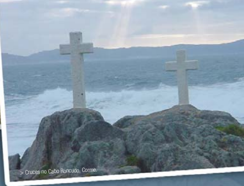
> Cruces no Cabo Roncudo, Corme