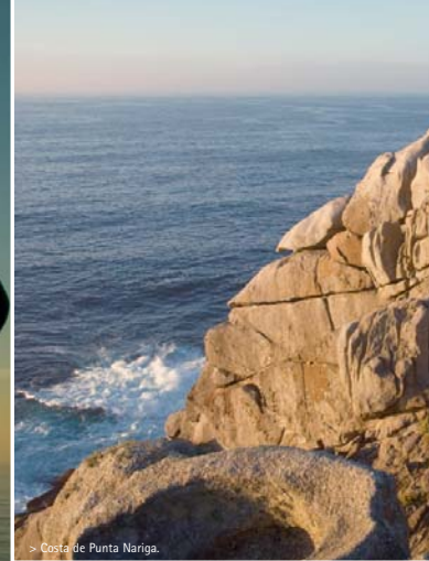
> Costa de Punta Nariga.