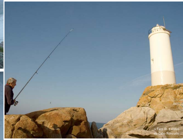
> Faro do e vistas do Cabo Roncudo