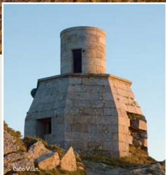
> Cabo Vilán.

nada y dejando el cementerio a la izquierda, seguimos subiendo durante un kilómetro hasta el faro de la localidad. Este último tramo está señalizado como ruta de senderismo y es recomendable hacerlo a pie para disfrutar del entorno y poder leer los paneles que se encuentran por el camino informándonos de las características de la zona. El faro de Laxe fue puesto en funcionamiento en 1920 igual que el de O Roncudo.