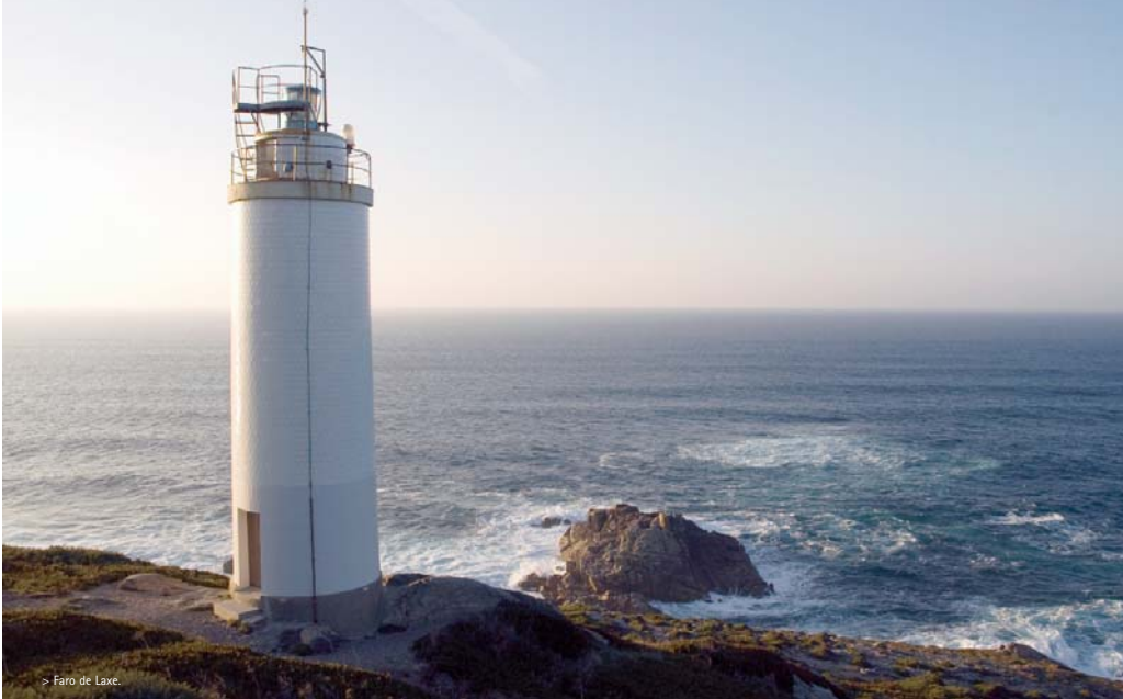
> Faro de Laxe.