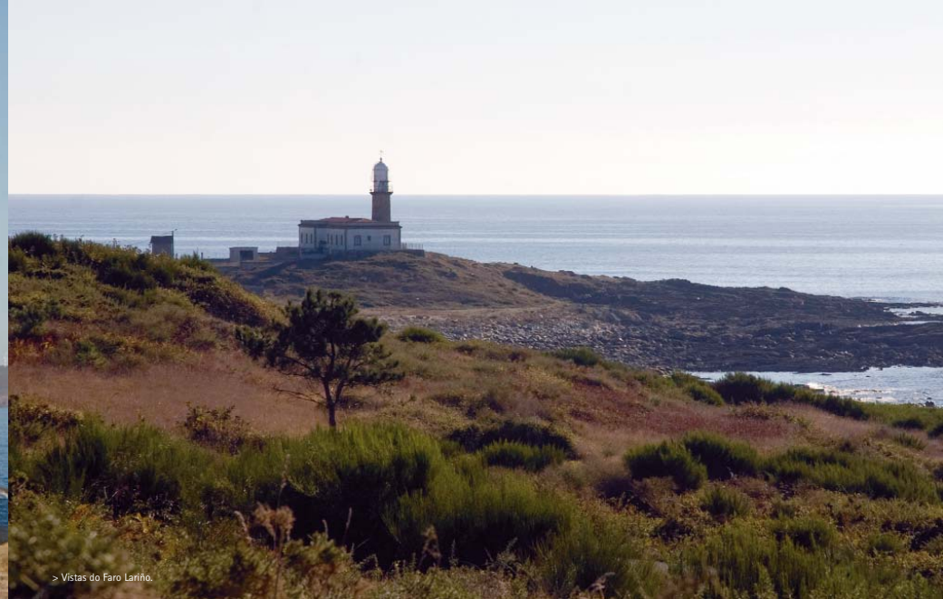
> Vistas do Faro Lariño.

Costa da Morte, está formado por varios módulos destacando el del Semáforo, convertido en hotel y restaurante, y el de la Sirena. En el exterior de este último está instalada la conocida como "vaca de Fisterra", una señal acústica que emite un sonido semejante al de este animal y que se utiliza en los días de mucha niebla cuando la luz de la linterna no puede ser vista por los barcos. En la última reforma realizada en el entorno se potenció la accesibilidad para el visitante y en el interior del edificio principal se instaló una oficina de información turística. Impresionante es la vista del faro desde lo alto del monte Facho o desde el monte de San Guillermo, donde en verano de 2007 se realizaron excavaciones arqueológicas para recuperar los vestigios medievales allí enterrados.