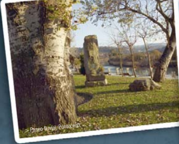
> Paseo fluvial, Ponteceso