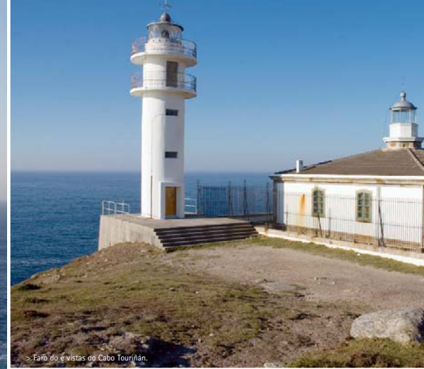
> Faro do e vistas do Cabo Touriñán.