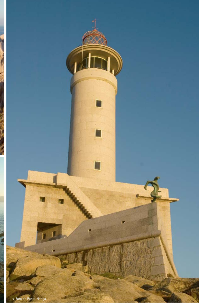
> Faro de Punta Nariga.

Muchas son las leyendas en torno a los faros y a la ubicación de éstos. Posiblemente tienen su origen en los fachos que desde hace mucho alumbran las cumbres de los montes próximos al mar con una doble función: ayuda en la navegación por los escarpados y peligrosos acantilados y como señal de aviso ante la llegada de embarcaciones extranjeras.