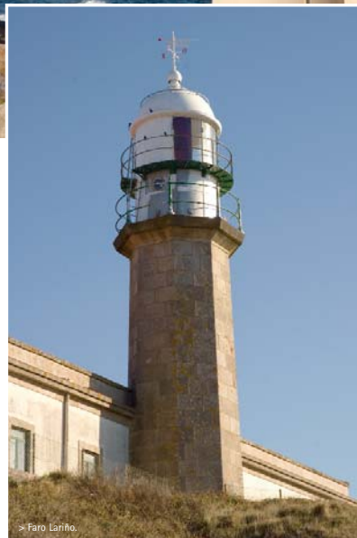
✦ Faro Lariño.