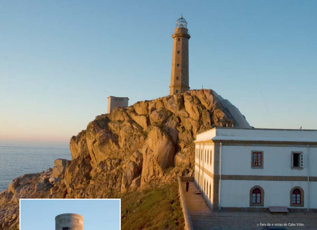
> Faro do e vistas do Cabo Vilán.