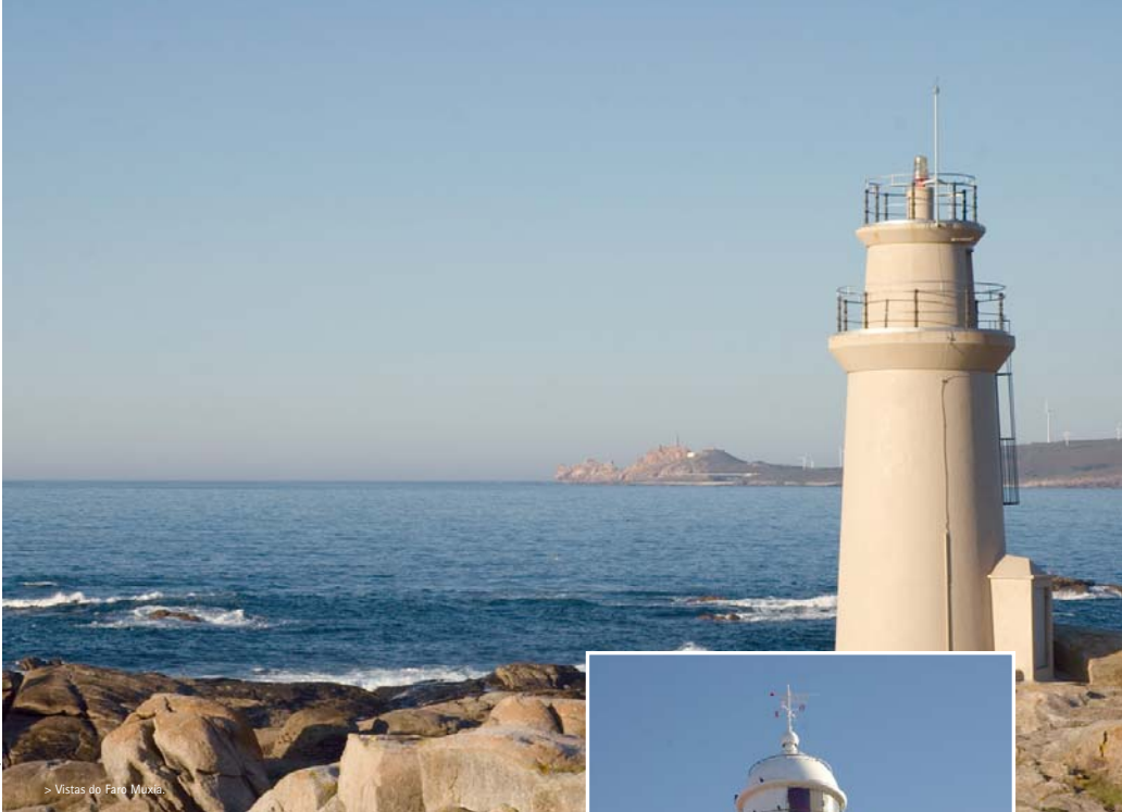
> Vistas do Faro Muxía.