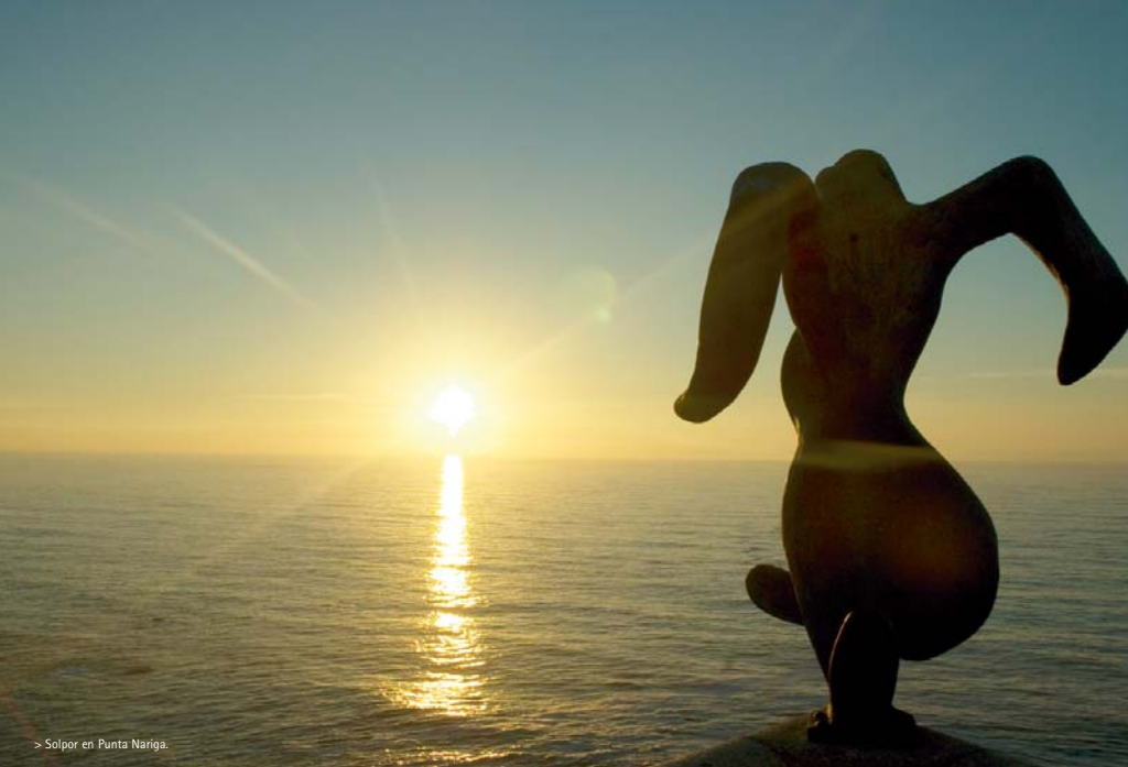
> Salpor en Punta Nariga.