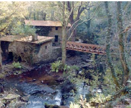
Refuxio de Verdes.

Só os mellores produtos e servizos se elixen cos ollos pechados. Porque en Galicia Calidade seleccionamos as marcas de maior prestixio