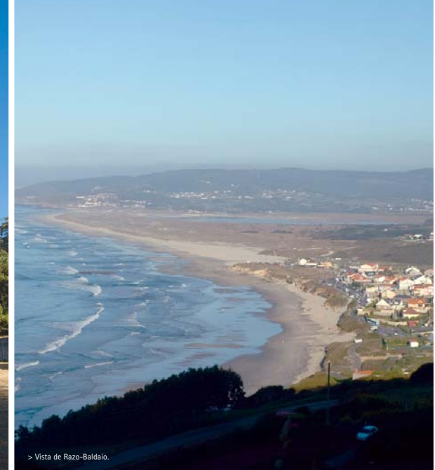
> Vista de Razo-Baldaio.

Para llegar a Caión (A Laracha), bien se puede hacer desde la capital municipal o desde la AC-552 a su paso por Arteixo en donde hay que tomar el desvío hacia Barrañán. Tanto escogiendo una como otra alternativa, las panorámicas de la pequeña península caionesa desde la carretera son impresionantes. Ya en el pueblo es obligado un paseo por la playa de As Salseiras, muy popular en verano, y a donde se accede desde el paseo marítimo. Monumentos destacables son la iglesia del Perpetuo Socorro y el derruido pazo de Graxal (siglo XII), que está previsto restaurar por sus actuales propietarios. Al continuar la ruta por la carretera hacia Carballo, se puede aprovechar para visitar el santuario mariano de Os Milagres en donde cada 8 de septiembre se celebra una de las dos romerías más populares de la Costa da Morte junto con la de A Barca de Muxía.