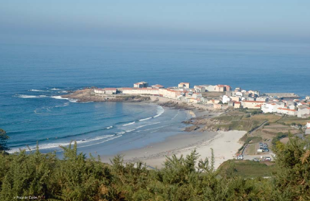
> Praia de Caión.