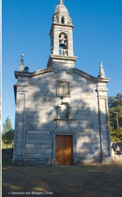
> Santuario dos Milagres, Caión.