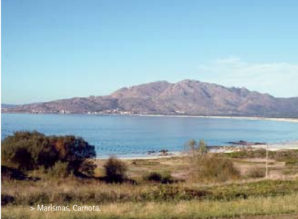
> Marismas, Carnota

Al comienzo de la carretera que sube al cabo se encuentra la iglesia románica de Santa María das Areas; y por el camino se puede ver el controvertido y todavía sin inaugurar cementerio de César Portela y luego subir al monte de San Guillermo, desde donde se aprecian unas impresionantes vistas. Entre ellas está nuestro próximo destino: la ferverza del Xallas.