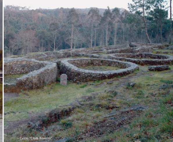
> Castro "Cidada Borneiro".

Dombate está considerado a "catedral" do megalitismo galego xa que é un dos monumentos desta época mellor conservados. Neste xacemento realizáronse as segundas excavacións máis importantes da