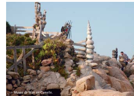
> Museo de Man en Camelle.

Continuaremos ahora hacia Muxia por la comarcal, villa en donde está situado el santuario mariano de A Barca