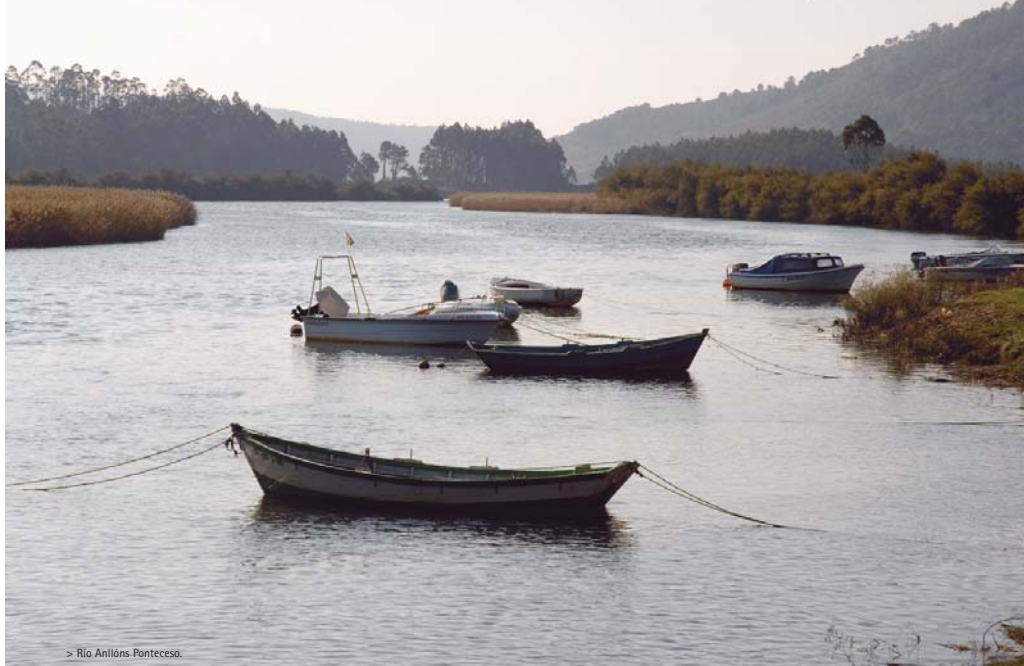
> Río Anllóns Ponteceso.

El municipio de Cabana guarda dos de los monumentos megalíticos de la "Costa da Morte". Para llegar hasta ahí, desde nuestra anterior parada continuamos hasta Nesaño y cogemos la carretera a Baio. En la mitad del camino, encontramos el indicador "A Cidada de Borneiro" y un poco más adelante el "Dolmen de Dombate".