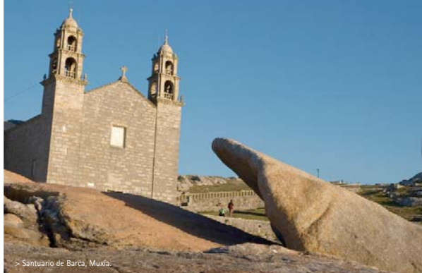
> Santuario de Barca, Muxía.